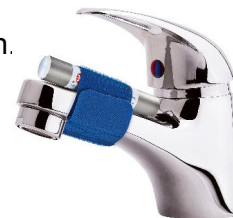
Am Wasserhahn HE 3060 0 1 € Gefäte.

Der Wasser-Impuls-Generator ist leicht zu installieren. Am Wasserhahn oder im Keller, ohne Eingriff ins Rohrsystem und dauerhaft wartungsfrei.