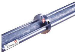
Weiss 1 m q,00 € HE 3920

Der Wasser-Impuls-Generator ist leicht zu installieren. Am Wasserhahn oder im Keller, ohne Eingriff ins Rohrsystem und dauerhaft wartungsfrei.