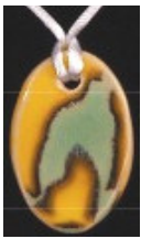
türkis-gelb HE 4000