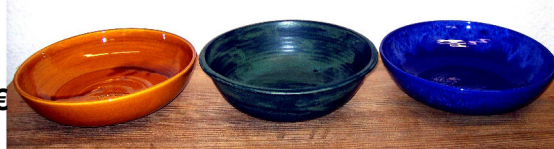
Blau 1 m q,00 € HE 3905

Die Energieschale neutralisiert die Schadstoffe in den Nahrungsmitteln. Sie erhalten die ursprüngliche Vitalität von hochwertigen Lebensmitteln. Sie sättigen schneller, schmecken besser, sind verträglicher, fördern den Stoffwechsel und sorgen für eine gesunde Verdauung. Der Körper bekommt, was er braucht. Die Energieschale energetisiert Medikamente, alle Dinge des täglichen Bedarfs und löscht die negativen Einflüsse von Toll-Collect.